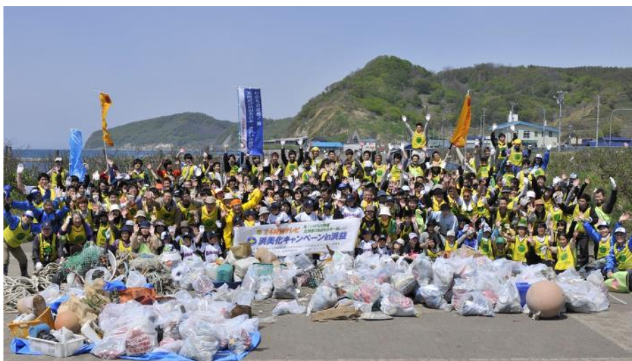
昨年は24時間テレビとの共催で、280人以上が参加しました。