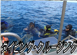
ダイビング・クルージング