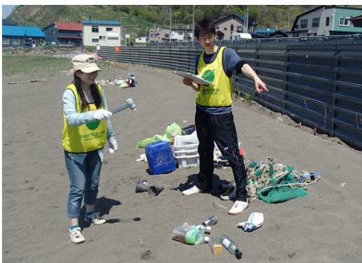
ビーチコーミングも行います