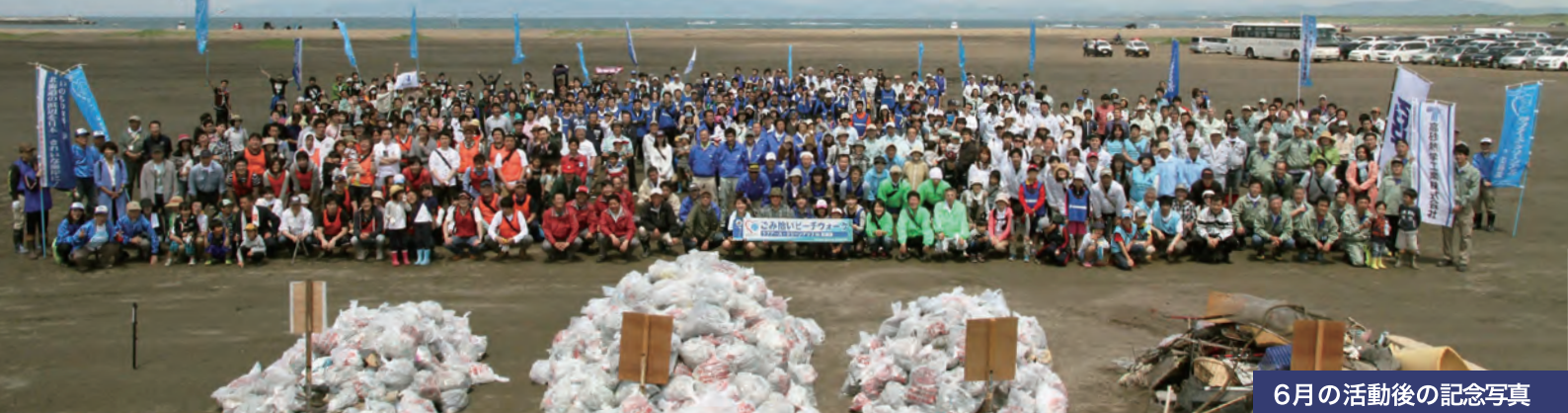
6月の活動後の記念写真

ラブアース・クリーンアップin北海道は、 私たちの北海道を私たちの手で、世界一きれいな場所にする、ごみ拾いのムーブメント。 ごみが一面に散らばっていた石狩の浜辺が、見事にきれいになる体験を一緒にしてみませんか!