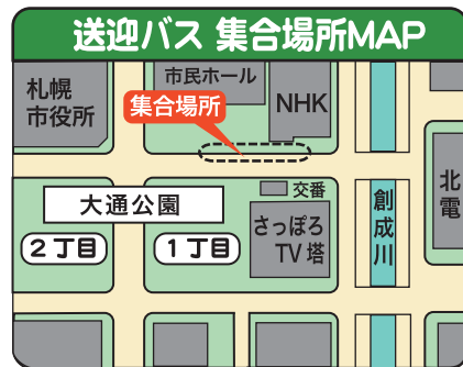
※大通公園1丁目北側