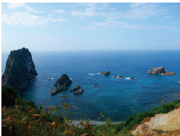
「日本の渚・百選」の島武意海岸