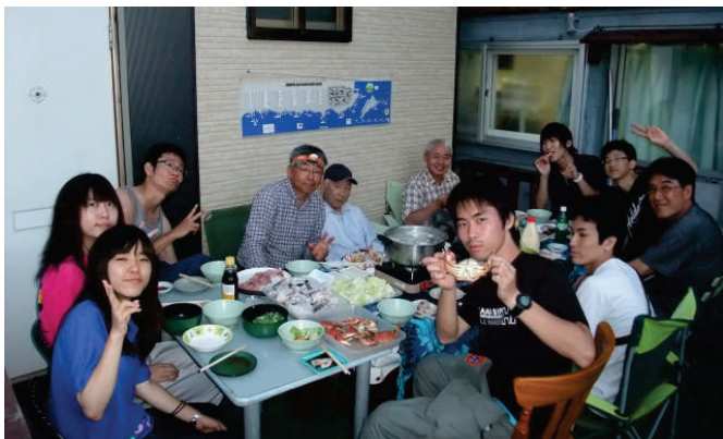
焼肉や、カニや刺身の海の幸も頂きました