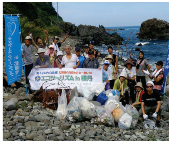
岩場で足場が悪く一苦労 ウニの殻の不法投棄