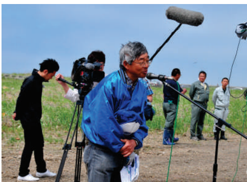
太田幹事が開会挨拶