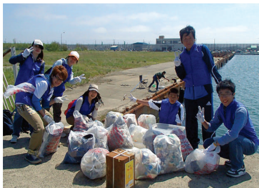
北海学園Pコネクションの学生