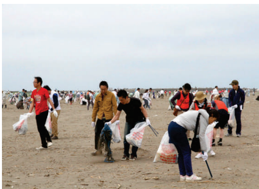
今年も大勢の人々が参加