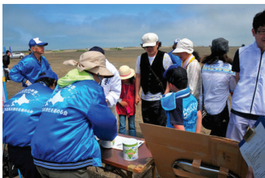
受付・ゴミ運搬の運営を行う