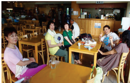
清掃後は温泉ですっきり