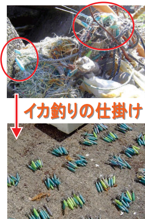
イカ釣りの仕掛け