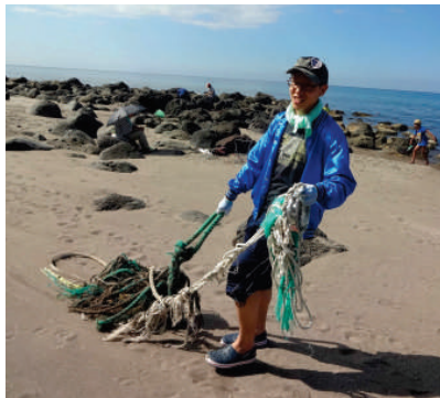
砂がついて重くなった漁網

25人が参加し、一泊二日で行われました。初日は、野塚野営場浜でゴミ拾い。浜の端に寄せられた大量のプラスチックゴミや、砂に埋もれたり、岩場に挟まった漁網を清掃。2日目は、幌武意海岸にて、堤防と消波ブロックの間の岩場をきれいになりました。