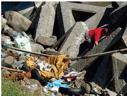
消波ブロックの隙間にもたくさん