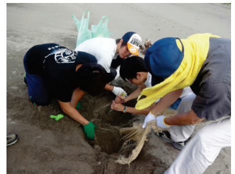
埋まったゴミを掘り起こす