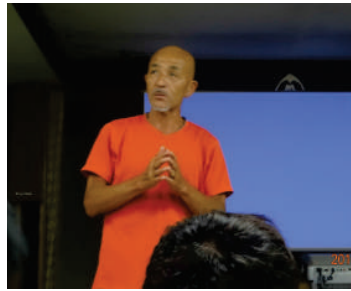
トドとの共生について