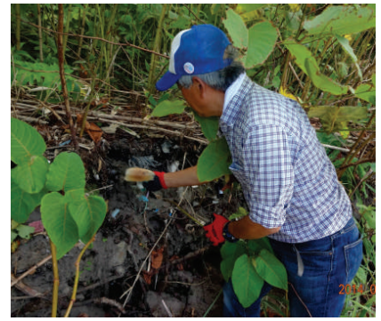
地層のように埋もれたゴミ