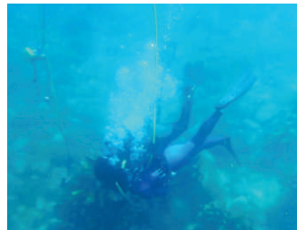
クルージングや体験ダイビング