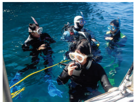
透明度の高いキレイな海