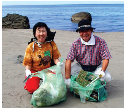
基盤がむき出しのモニター