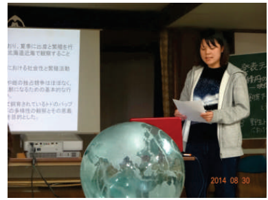
酪農学園大生の発表