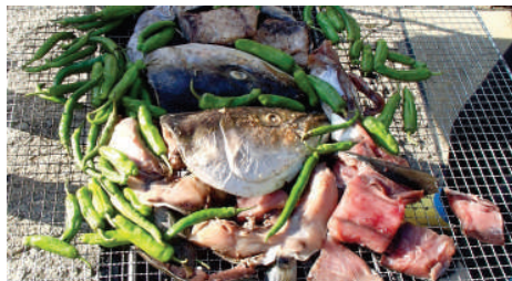
ブリや毛ガニ、アワビ鍋など